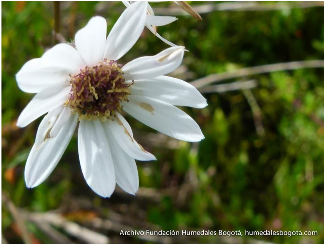
Ilustración 1 Margarita de Pantano (Senecio Carbonelli) Única en el mundo – solo crece en el Humedal La Conejera