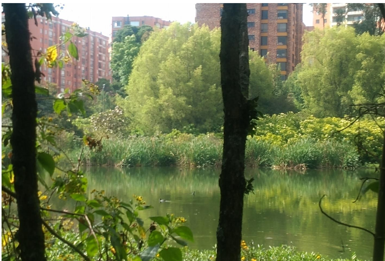
Ilustración 3 Humedal Córdoba “Una jungla en la ciudad” (7/oct/2019)