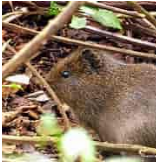
Ilustración 2. Curi sabanero del Humedal La Conejera.