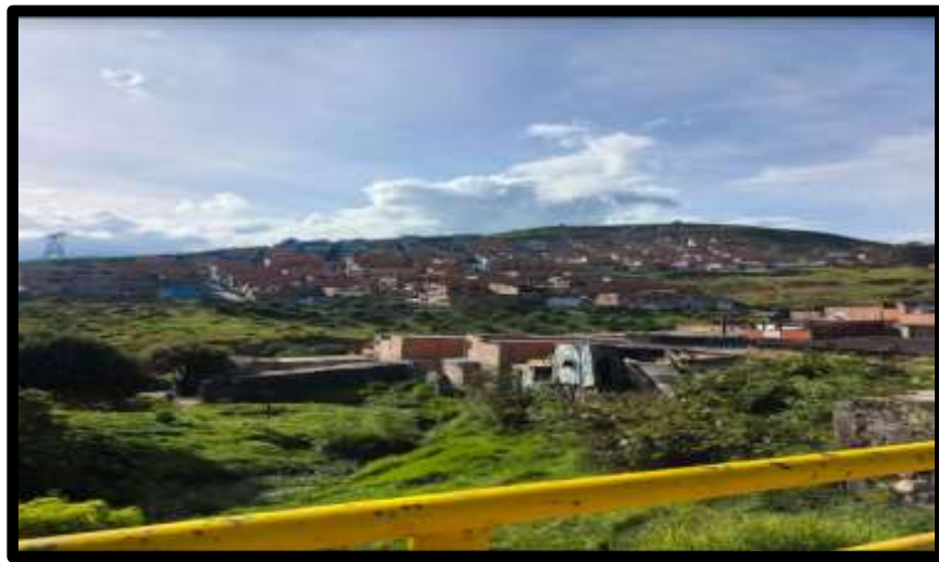
Imagen barrio Divino Niño.

Nota. Fuente: Registro fotográfico de elaboración propia. (2022).