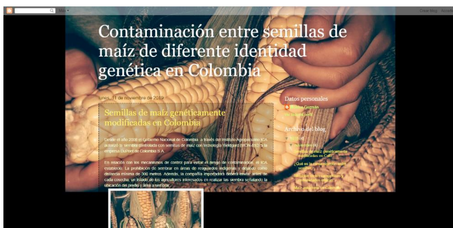
Figura 6. Vista de pantalla del blog sobre el tema.

Dentro de las herramientas tecnológicas que existen en la actualidad, también se desarrolló un blog con el fin de hacer llegar esta información a un público focalizado que tenga los mismos intereses al respecto, teniendo en cuenta que en estos espacios se puede debatir, porque las personas pueden expresar sus opiniones y compartir posiciones, de tal manera que se pueda construir un discurso propositivo acerca del tema. El blog está disponible en el enlace: https://polinizacionmaiz.blogspot.com/ y su vista de pantalla se presenta en la figura 6.