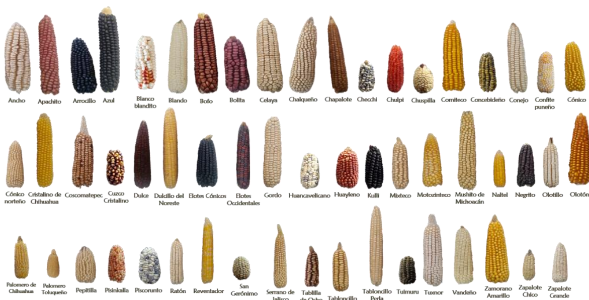
Figura 3. Variedades autóctonas de maíz mexicano.

En México el maíz se consume de muy diversas maneras, directamente como mazorca asada o cocida, y también como harina para elaborar tortillas, tamales y bebidas. Además tradicionalmente se ha utilizado el maíz por las culturas antiguas en la región de otras diversas maneras, como por ejemplo para sus ceremonias religiosas, las hojas secas se utilizan como fibra para tejidos, la rutina del cultivo ayuda a marcar diferentes épocas en su calendario, etc. En la actualidad en México también se elaboran otros productos como aceite, combustible y plástico a partir del maíz (Pigeonutt, 2018). México se considera el centro del origen del maíz y en su territorio se pueden hallar unas 64 variedades, de las cuales, las 56 enumeradas en la figura 3 son consideradas autóctonas (Taba, 1994).