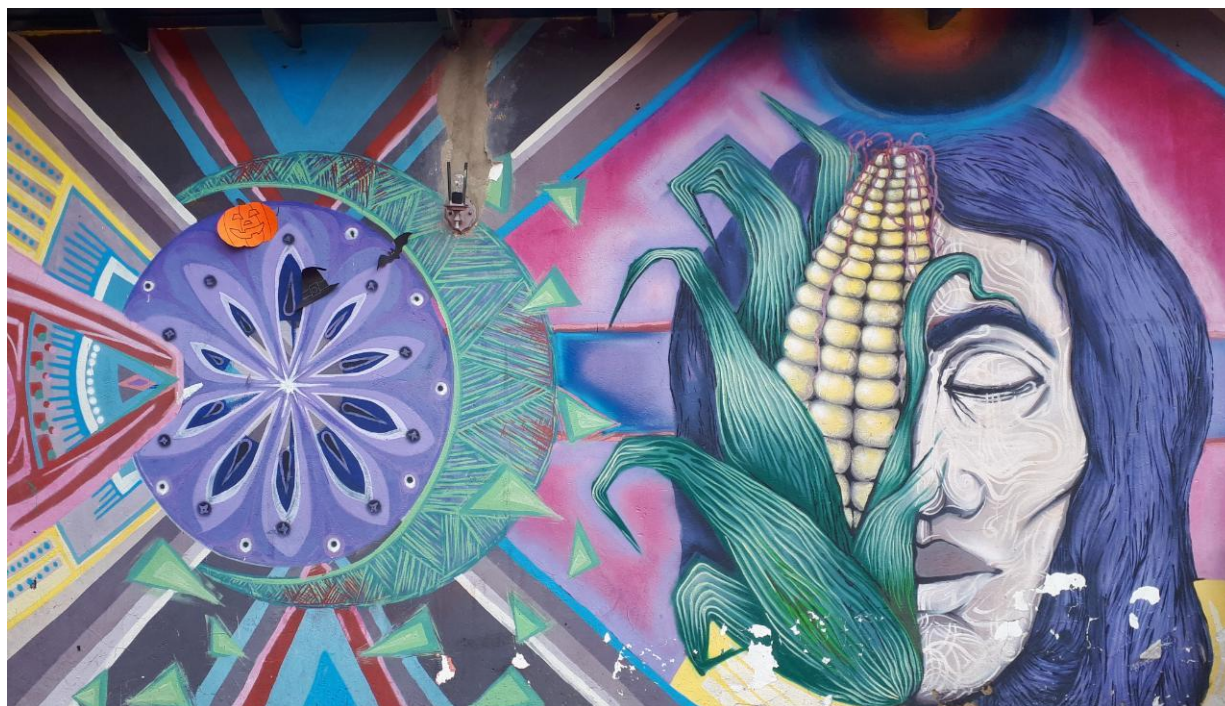
Figura 4. Fotografía del mural de la casa de la cultura de Bosa.

A través de la presente investigación se han podido evidenciar los diferentes mecanismos de control y protección tendientes a mitigar y prevenir el riesgo de contaminación entre las semillas de diferente identidad genética. Del mismo modo, puede observarse la ausencia de un criterio unificado a nivel global para evitar la contaminación entre semillas. Este paradigma surge a partir de la falta de certeza científica respecto a las consecuencias de la implementación de la biotecnología en la naturaleza.