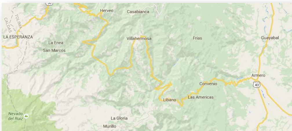
Ilustración 11. Ubicación de Armero

En referencia a que el proceso se realizó tanto en la ciudad de Bogotá como en los alrededores de la desaparecida población del Tolima. Por otro lado, en la ciudad de Bogotá se encuentran muchos de los documentos que hacen parte de la información en la que se centra el estudio como los son el libro blanco y el libro verde construido por la F.A.A. se debe de tener en cuenta la capital del Tolima, Ibagué pues allí se encuentra consignado el llamado Libro Rojo antes referenciado.