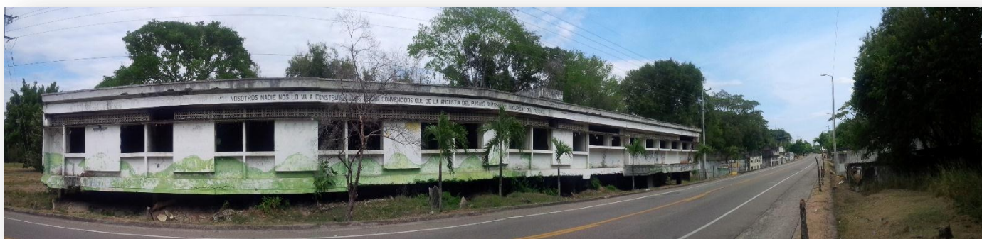
Ilustración 6. Hospital de San Lorenzo 30 años después

El significado que las personas le dan a los espacios son construcciones propias de las relaciones interpersonales y el arraigo territorial, es por esta razón que así pasen años el recuerdo de su pueblo natal seguirá presente, además del valor para cada uno de ellos, lo anterior es un acercamiento a lo que realmente pasó luego de la tragedia, la pérdida es una palabra con un significado entre los que encontramos la mezcla del dolor, la desesperación, y la incertidumbre del futuro venidero, es por esta razón que se habla de lo que fue realmente Armero para sus habitantes y lo que aún perdura durante los años y el tiempo, pues el amor por estas tierras y su historia obliga a sus sobrevivientes a volver cada 13 de noviembre, a recordar y honrar a las personas que allí murieron; la romería que se congrega, en el espacio que ocupaba el parque principal, es inmensa y se recuerda cómo aquella noche en la que desapareció más que su pueblo, su tierra, sus recuerdos y parte de su vida pasada debajo de montones de lodo, muchos de los padres y madres regresan cada año con la esperanza de encontrar a sus hijos perdidos en ese mismo lugar donde les fueron arrebatados.