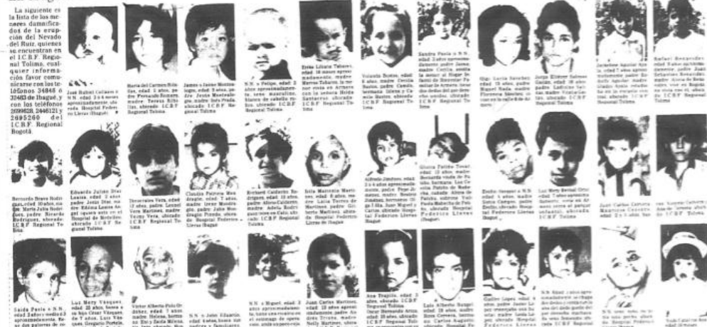
Ilustración 5. Anuncios de los menores rescatados por el ICBF

La siguiente es la lista de las marcas distintivas de la erupción del Nevado del Ruiz, sucesos que se encuentran en el ICBF Regional Tolima, cualquier información favor comunicarse con los teléfonos 248484 ó 23443 de Ibagué, y con los teléfonos 2999028, 2466121 ó 2082266 del ICBF Regional Bogotá.