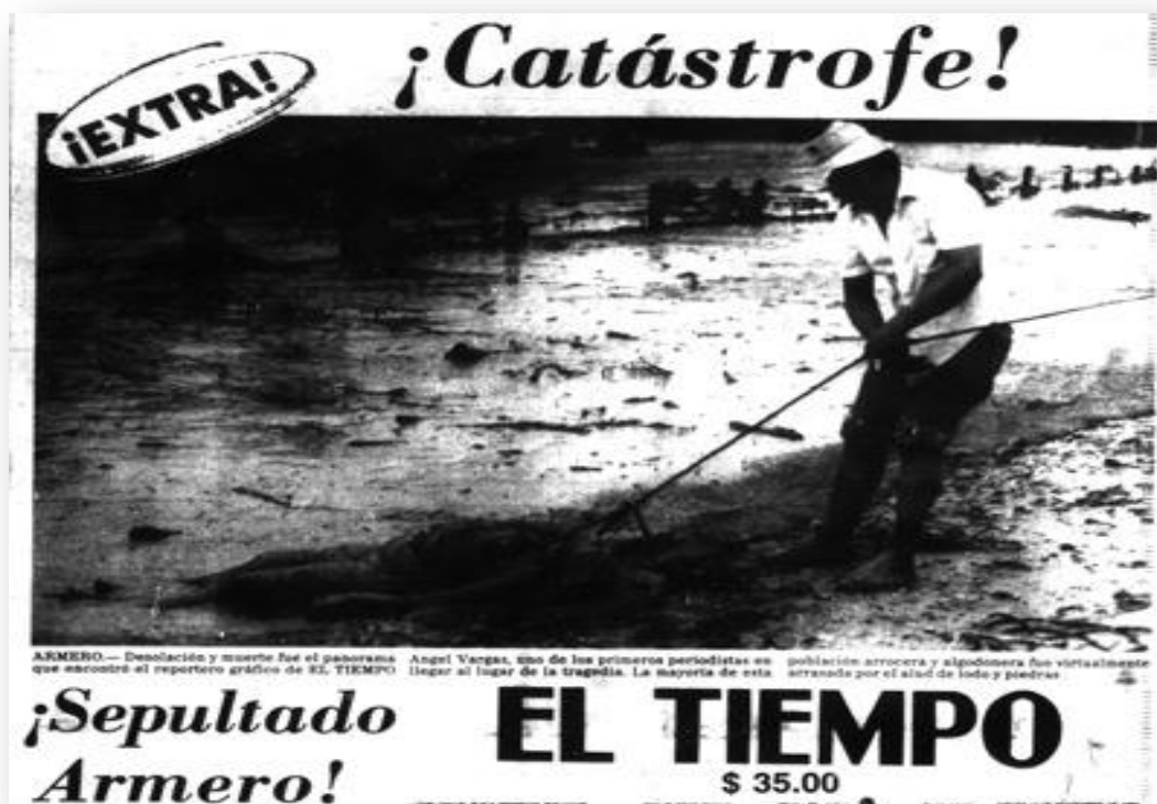
Ilustración 1 Noticias de la tragedia de Armero

Los días posteriores a la tragedia fueron relatados en las noticias a través de las publicaciones de periódicos de la época tales como El Tiempo y El Espectador Diarios de la mañana de Circulación Bogotá, de la siguiente forma: