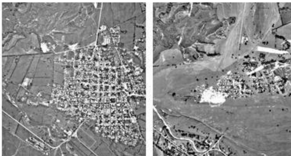
Ilustración 9 Armero Antes y Después de la Avalancha.

El municipio se encuentra ubicado al norte del Tolima cerca de las poblaciones de Lérica, Mariquita y lo que es en el presente Armero Guayabal, muy cerca se encuentra la carretera nacional que comunica la capital de Ibagué con las ciudades de Honda y La Dorada, lo aproxima el río lagunilla; el municipio está situado a 352 msnm. Tiene una temperatura promedio de 27 °C. La distante de la ciudad de Ibagué, capital del mismo departamento, es a unos 95 km.