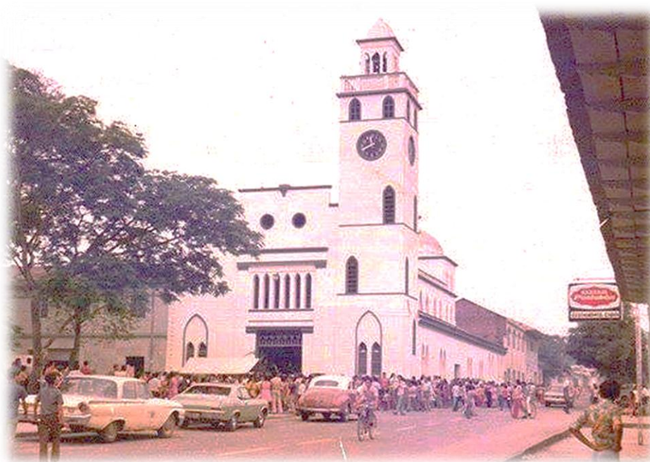
Ilustración 8. Armero antes de la avalancha

La presente es una breve descripción de lo que fue la cabecera municipal de Armero Tolima antes y después de la tragedia, resaltando algunas de los aspectos geográficos, económicos y culturales. Los cuales hicieron sobresalir esta población frente a las demás del Tolima e incluso de Colombia.