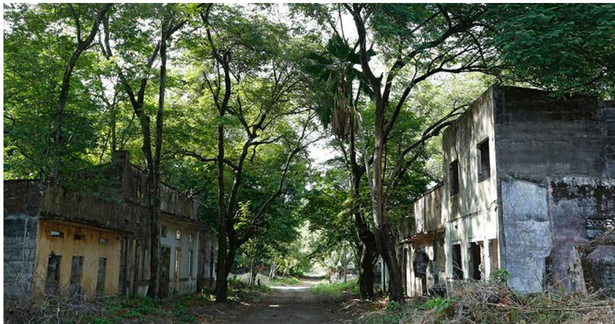
Ilustración 10 Armero hoy.

Cabe aclarar que este estudio se realizó con el aval de la F.A.A. que tiene sus instalaciones en la Ciudad de Bogotá, en el Barrio Chico, y también adelanta procesos en la desaparecida población y sus alrededores, teniendo en cuenta que ésta es una zona de alto riesgo por las características geográficas que posee y los antecedentes históricos, es por esta razón que se retoman aspectos geográficos y de ubicación principalmente de Armero Tolima.