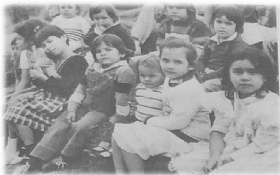
Ilustración 4. Niños de Armero al cuidado del ICBF

Unos están heridos y enfermos en clínicas, Hospitales, puestos de salud. Otros están en manos del Instituto Colombiano de Bienestar familiar. Otros fueron recogidos por familias caritativas que esperan devolverlos a los padres cuando estos aparezcan. Otros fueron robados: unos para comercializar con ellos como si fueran mercancía; otros para colmar el vacío que sienten algunas parejas que no han podido tener hijos. Otros afortunados, encontraron a su familia. Así más o menos están repartidos los niños que había en Armero en aquella noche del 13 de noviembre. Nieto de Samper , (1985)