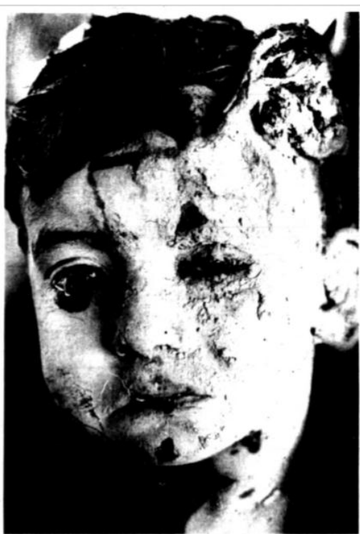
Ilustración 3. Rescatado del fango