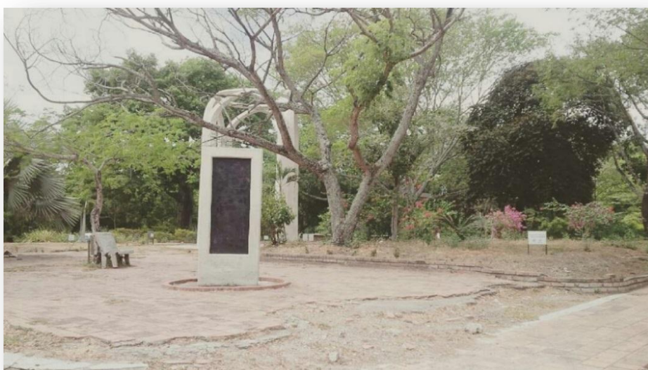
Ilustración 7. Armero parque principal 30 años después.

El significado que las personas le dan a los espacios son construcciones propias de las relaciones interpersonales y el arraigo territorial, es por esta razón que así pasen años el recuerdo de su pueblo natal seguirá presente, además del valor para cada uno de ellos, lo anterior es un acercamiento a lo que realmente pasó luego de la tragedia, la pérdida es una palabra con un significado entre los que encontramos la mezcla del dolor, la desesperación, y la incertidumbre del futuro venidero, es por esta razón que se habla de lo que fue realmente Armero para sus habitantes y lo que aún perdura durante los años y el tiempo, pues el amor por estas tierras y su historia obliga a sus sobrevivientes a volver cada 13 de noviembre, a recordar y honrar a las personas que allí murieron; la romería que se congrega, en el espacio que ocupaba el parque principal, es inmensa y se recuerda cómo aquella noche en la que desapareció más que su pueblo, su tierra, sus recuerdos y parte de su vida pasada debajo de montones de lodo, muchos de los padres y madres regresan cada año con la esperanza de encontrar a sus hijos perdidos en ese mismo lugar donde les fueron arrebatados.