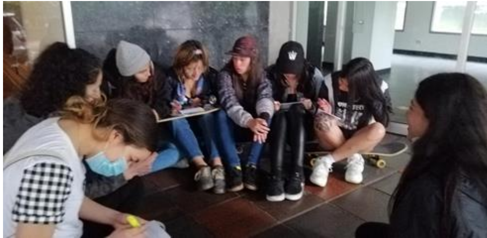
Anexo 5. Grupo Focal.