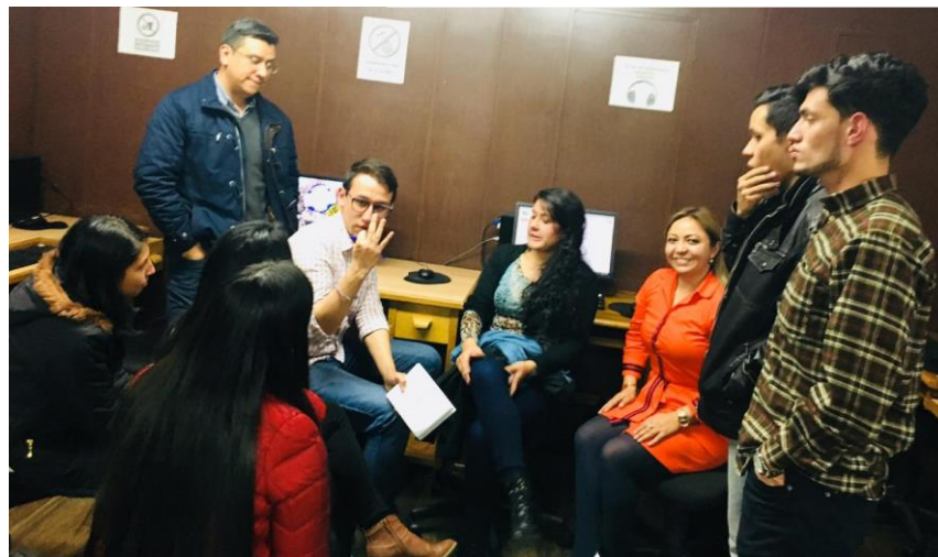
Año 2018- Fase Oral, el equipo se encontraba preparándose para las rondas orales, debatiendo los argumentos más importantes.