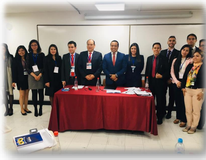
Año 2018. Fase oral, Audiencia final del día 3 de la competencia, junto a los árbitros que precedieron la audiencia.

Aunado a lo anterior, por medio de la competencia se permitió realizar una serie de eventos que si bien no están relacionados directamente con la Competencia, a raíz de la primera participación surgieron dichos eventos.