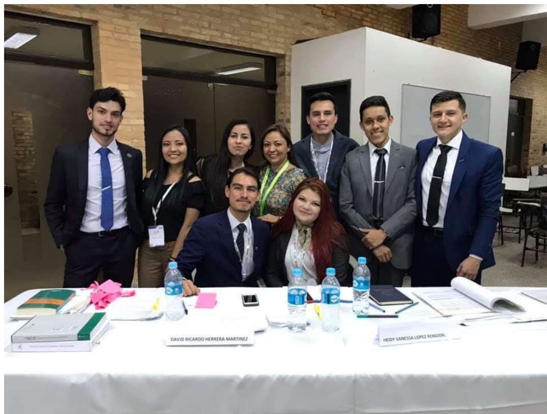
Foto tomada después de salir de la última audiencia, teniendo el rol como demandados.