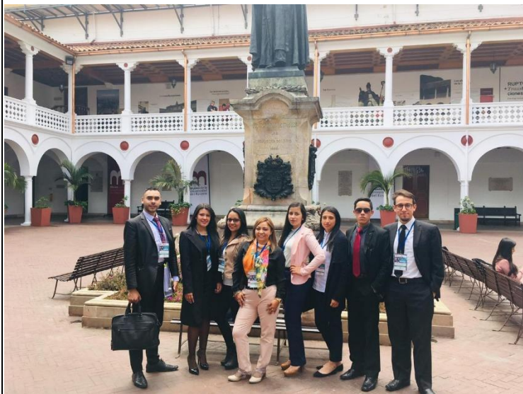
Día 3. Finalizando la primer audiencia del día como demandados, en la Universidad del Rosario.