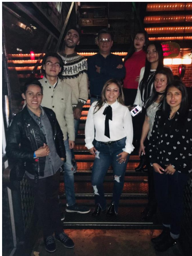
Día 4. En la cena de consolación, permitiendo establecer lazos académicos con otras universidades y profesionales en arbitraje comercial internacional.