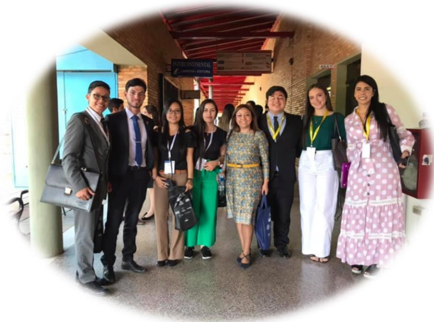
Año 2019- Fase oral, día 3 de la competencia, junto con el equipo de la Universidad Surcolombiana de Neiva.