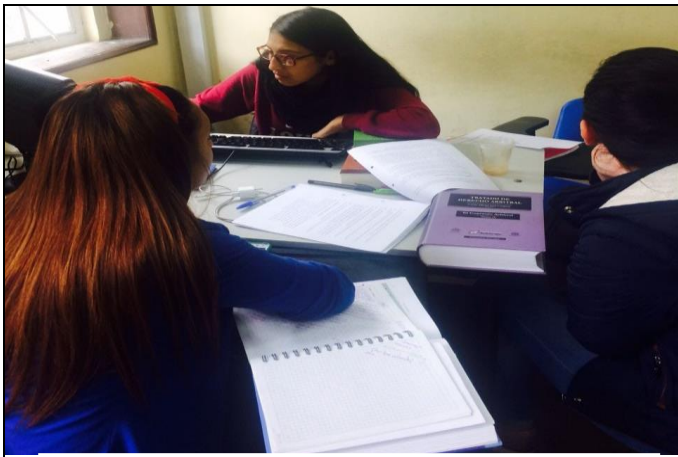
Año 2018- Fase escrita, análisis de normativa internacional aplicable al caso.