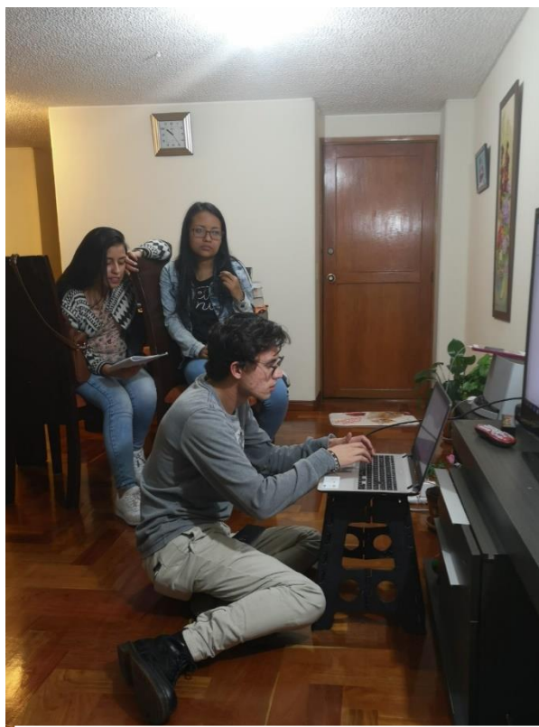
Año 2019- Fase escrita, Elaboración de la memoria de demandante.