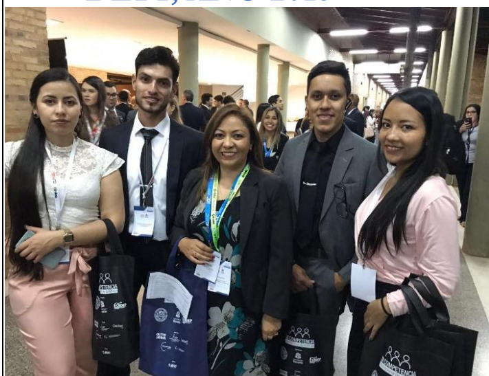
Acto inaugural de la XII competencia internacional de Arbitraje en la Universidad Nacional de Asunción