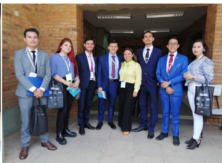
Día 2. Finalizando la Primera Audiencia del día, fungiendo como demandantes.