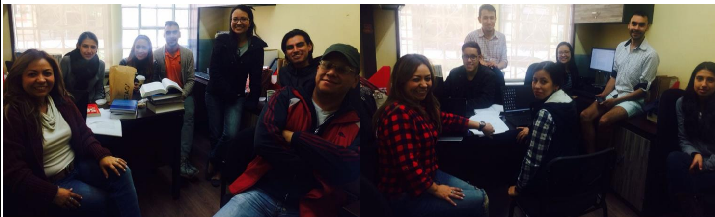
Año 2018- Fase escrita, elaboración de la demanda