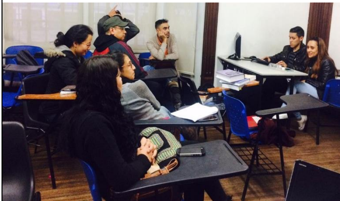
Año 2018- Fase escrita, finalizando la elaboración de la memoria de demandantes.