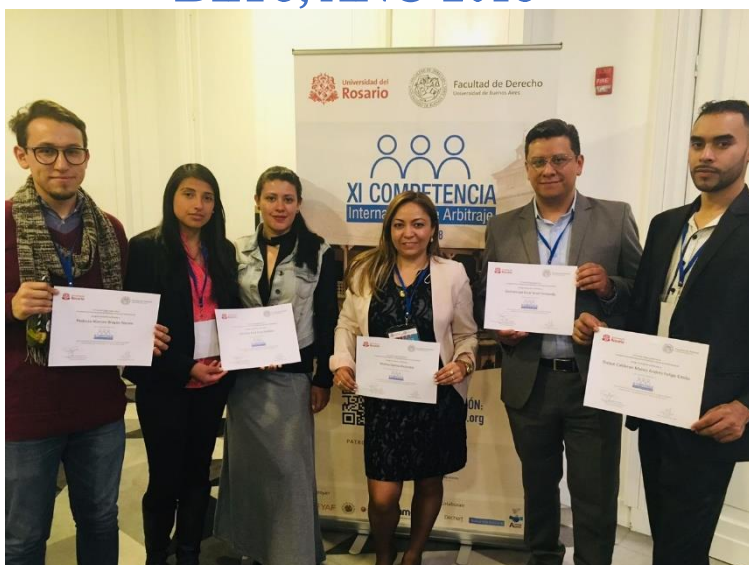
Día 5. Último día de la competencia, estudiantes participantes del concurso recibiendo su certificado de participación.