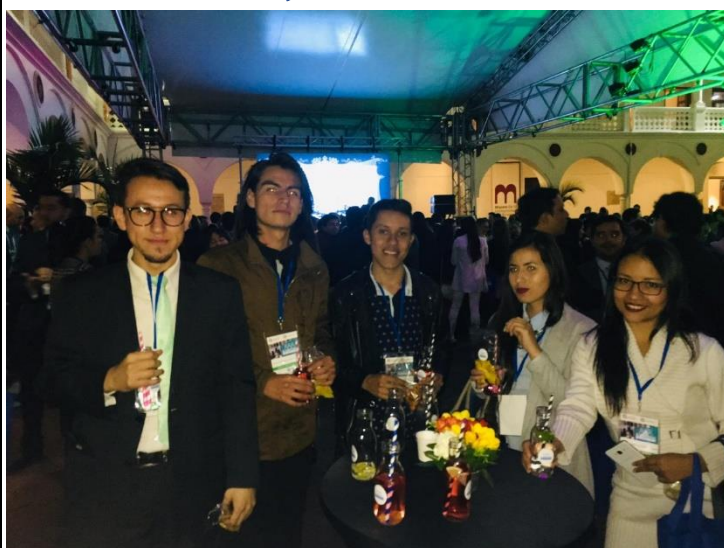
Acto inaugural de la XI competencia internacional de Arbitraje en la Universidad del Rosario